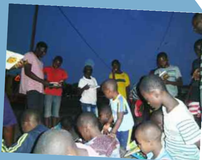
Dzieci w Togo