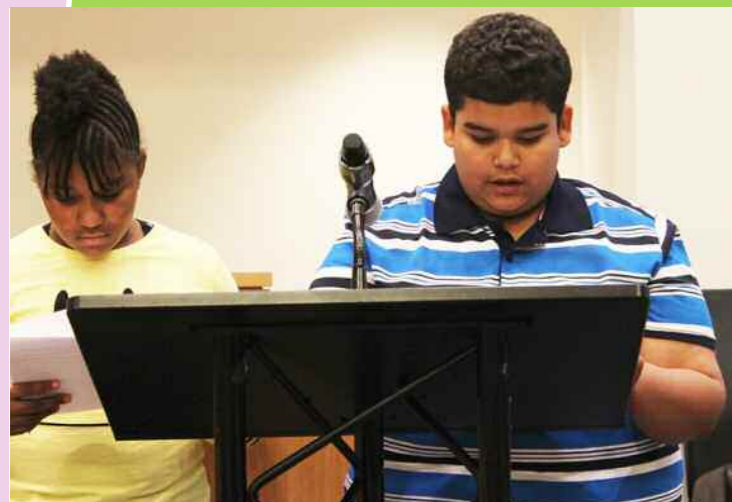
Dzieci czytają swoje przesłania.

My, dzieci, możemy działać razem, by z tym walczyć poprzez dawanie przykładów dobrego zachowania, nie zastraszanie innych i pomaganie tym, którzy są zastraszani."