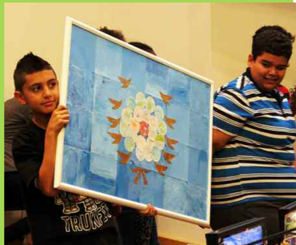
Dzieci prezentują flagę ONZ, którą stworzyły w czasie Biblioteki Podwórkowej w Nowym Jorku.